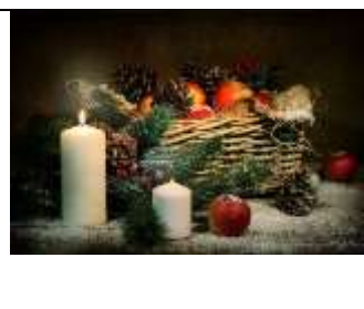
А) Новый год