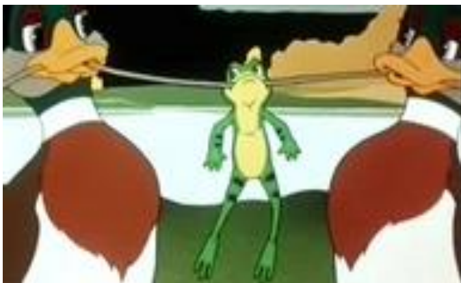
Право на свободу передвижения