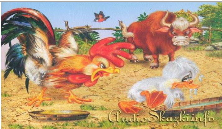
Право на уважение, гражданство