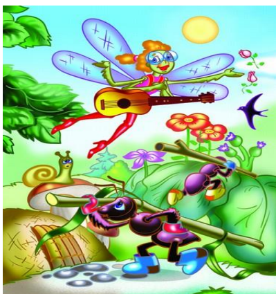
Право на труд и вознаграждение