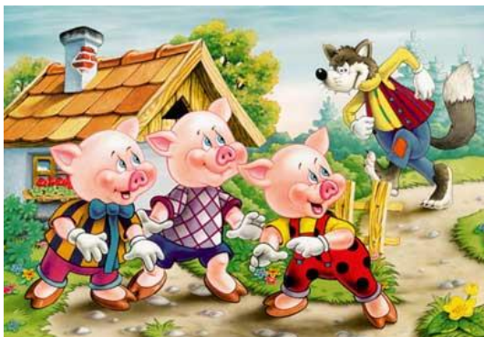
Право на защиту

Это лишь некоторые права, которые отражены в «Конвенции о правах ребенка».