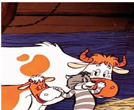
Право на имущество